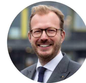
Namens alle Achterhoek ambassadeurs

We presenteren onze Achterhoek Visie met trots, om onze unieke regio over de volle breedte verder tot bloei te brengen.