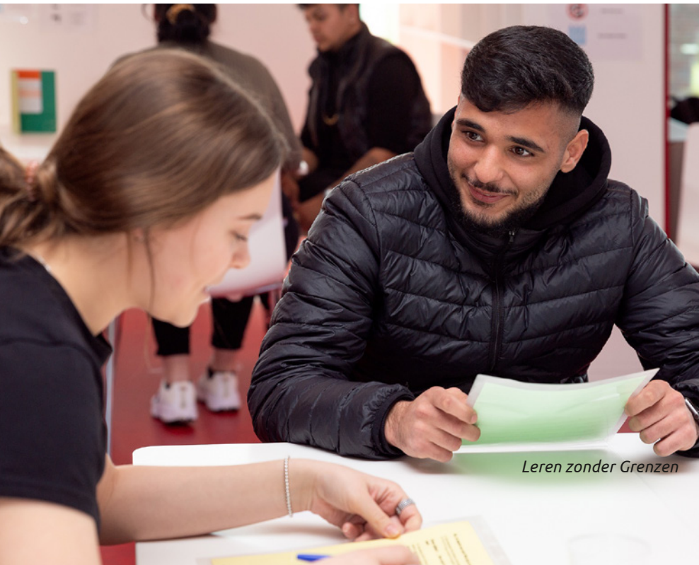
Leren zonder Grenzen

Het Grenzhoppers-netwerk vormt de basis van waaruit de samenwerking tussen ondernemers, gemeenten en onderwijsinstellingen gestalte krijgt. We zijn als Achterhoek onderdeel van Oost-Nederland, maar ook van de EUREGIO en