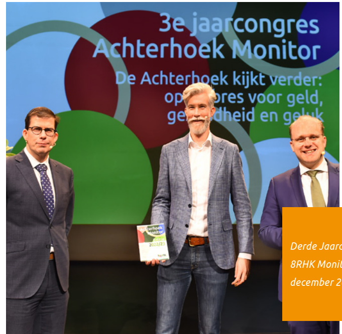
Derde Jaarcongres 8RHK Monitor, december 2022