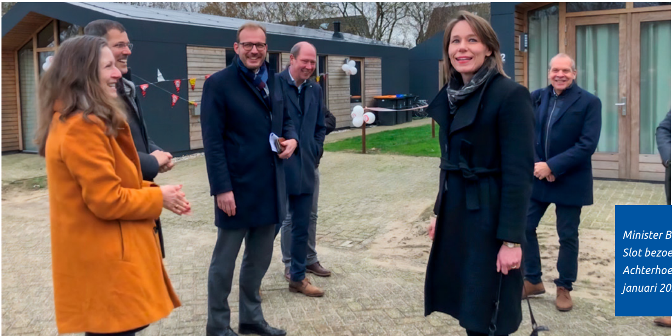
Minister Bruins-Slot bezoekt de Achterhoek, januari 2023

van de Achterhoek Monitor. Deze is doorontwikkeld zodat we nog meer en adequatere informatie voorhanden hebben over de woningopgave en de vorderingen van de in de Woonagenda opgenomen doelstellingen.