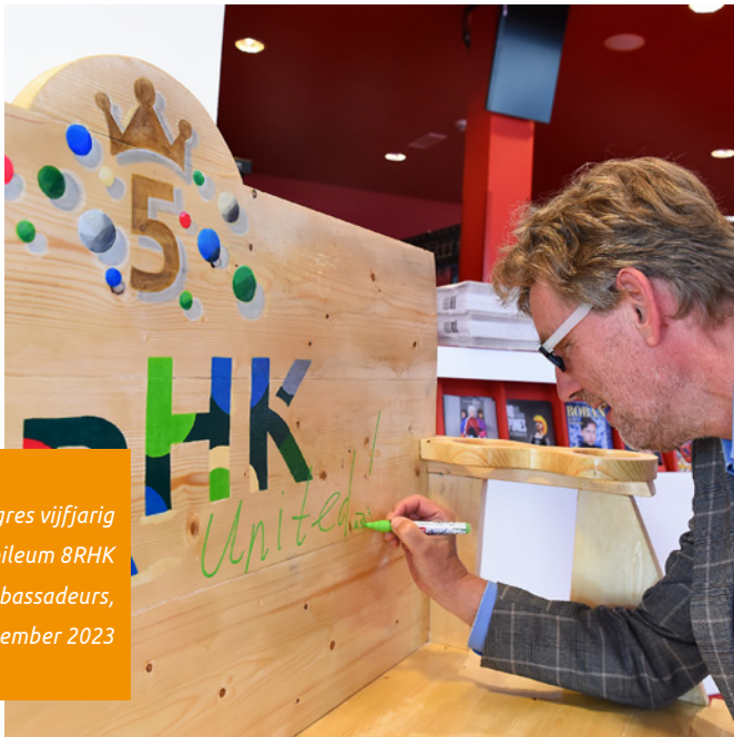
Congres vijfjarig jubileum 8RHK ambassadeurs, september 2023