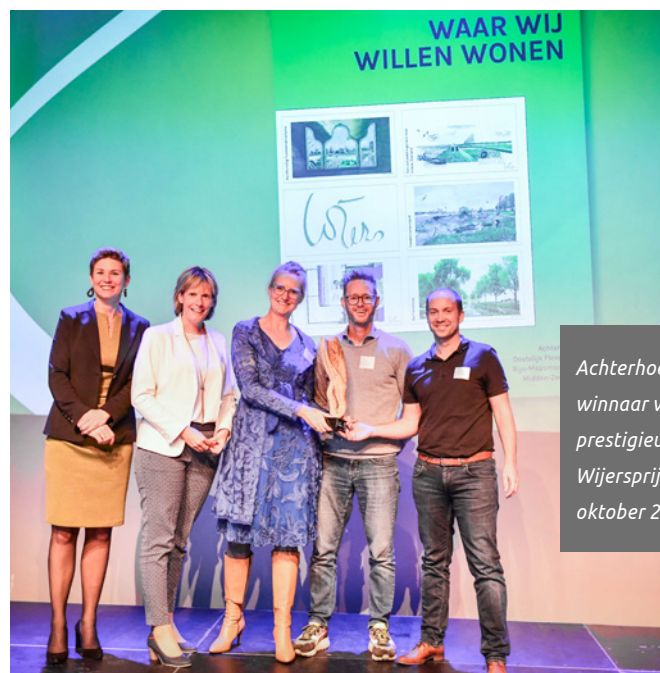
Achterhoek landelijk winnaar van de prestigieuze Eo Wijersprijsvraag, oktober 2023