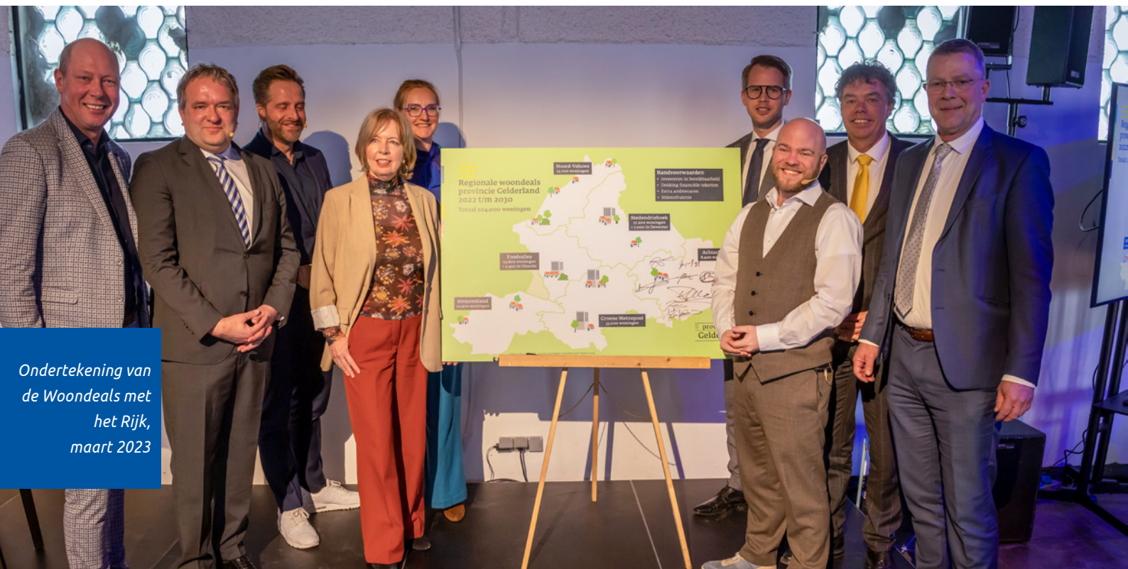
Ondertekening van de Woondeals met het Rijk, maart 2023

We meten onze voortgang en de ontwikkelingen in de woningmarkt via de Woon- en Vastgoedmonitor als onderdeel