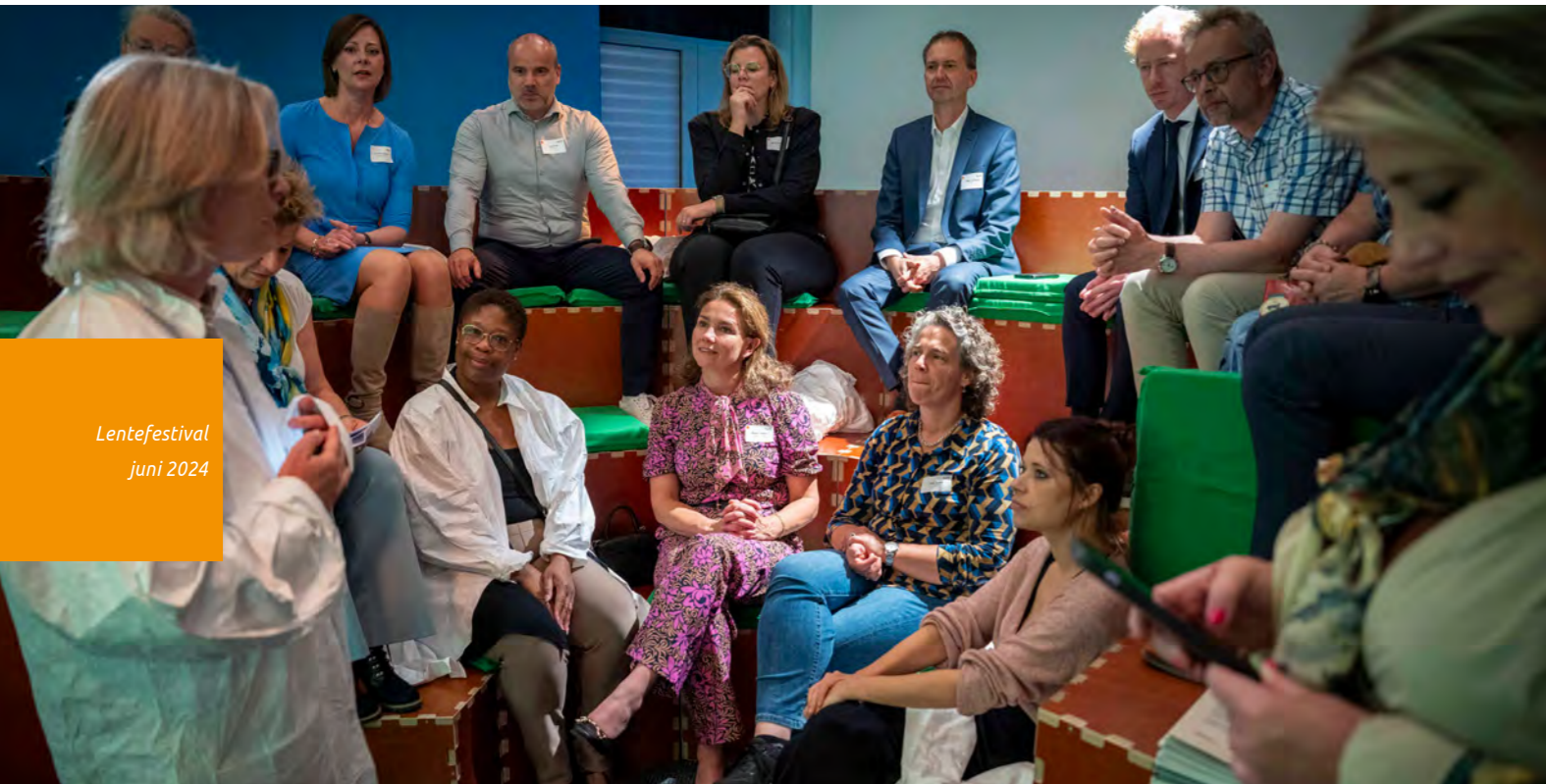
Lentefestival juni 2024

Elke Regio Telt. Hiervoor zijn miljarden aan middelen en menskracht nodig. Om de infrastructuur op peil te brengen, woningen te bouwen en Rijksdiensten in de regio te vestigen."