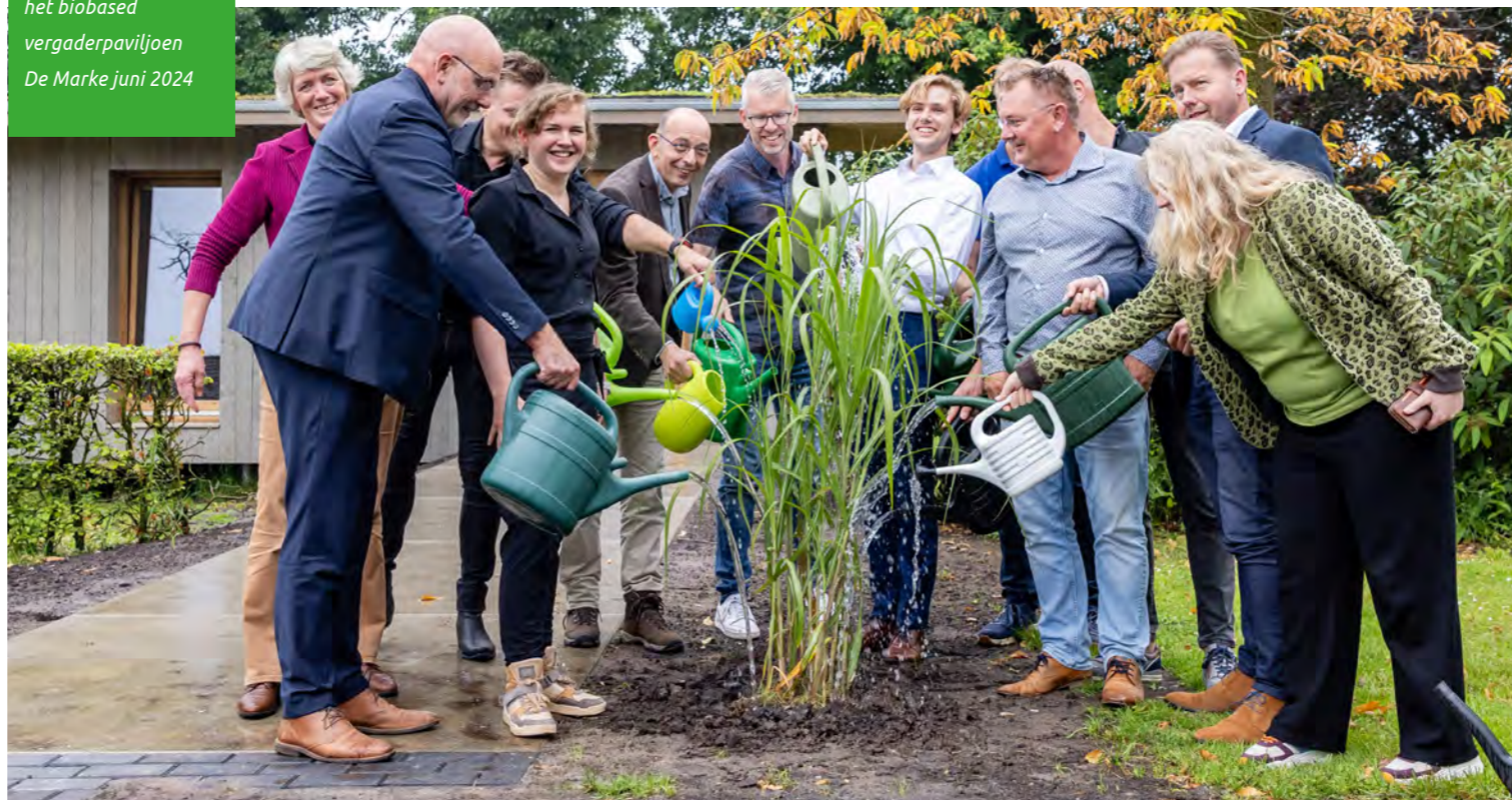
Opening van het biobased vergaderpaviljoen De Marke juni 2024