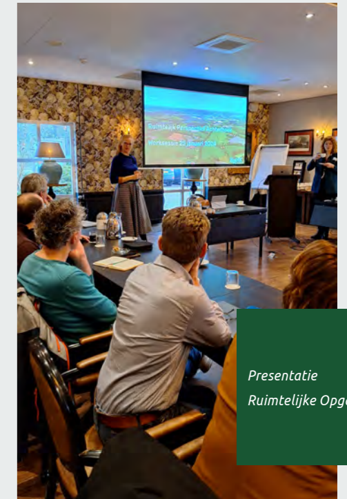
Presentatie Ruimtelijke Opgaven

In 2025 blijven we een actieve bijdrage leveren aan de ruimtelijke processen van onder andere de Provincie, met name het Ruimtelijk Arrangement.