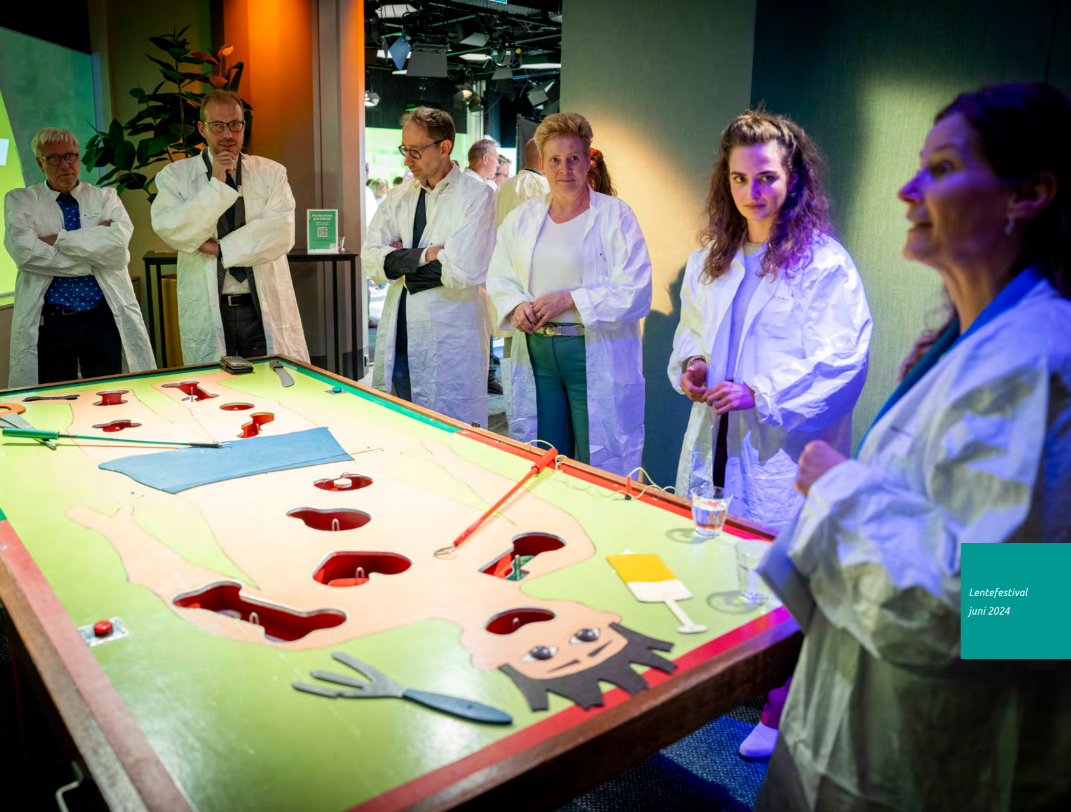
Lentefestival juni 2024