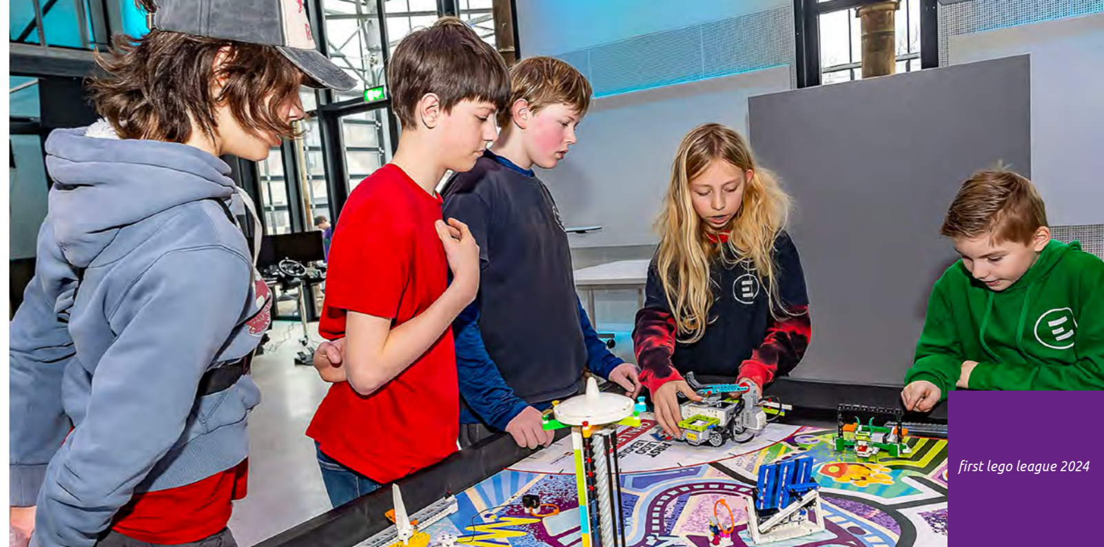
first lego league 2024