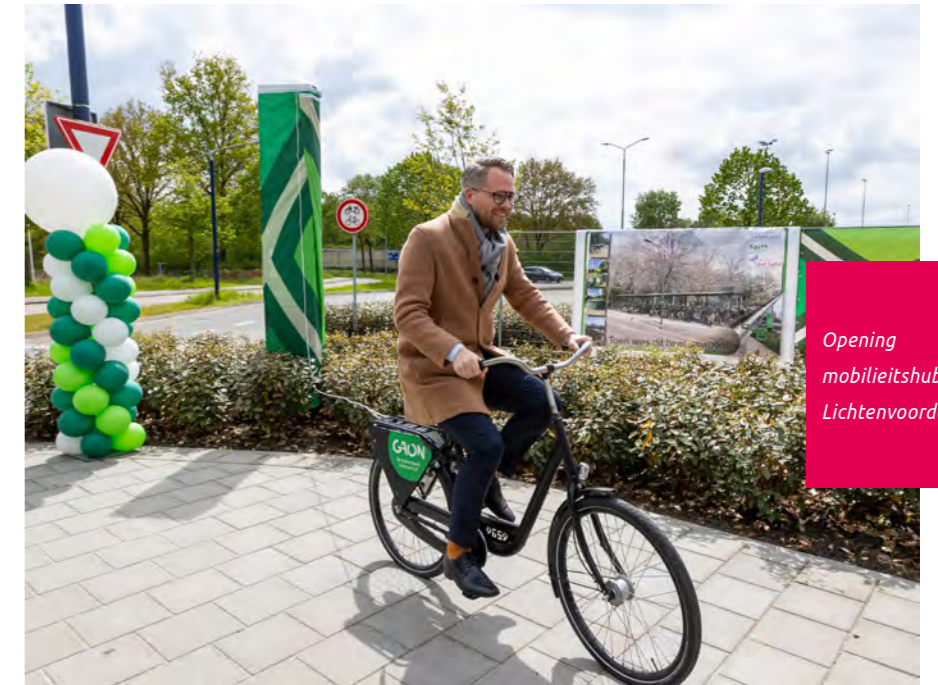
Opening mobiliteitshub Lichtenvoorde

de deelauto in het netwerk van Gaon stimuleren.