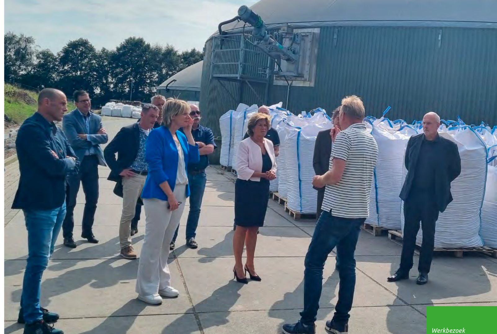
Werkbezoek gedeputeerden Augustus 2024

we de kennisbasis en leren we van praktijkervaringen. Bij experimenten wordt in de uitvoering ook aandacht besteed aan de doorontwikkeling na de experimentele fase. Dit met oog op wet- en regelgeving, (juridische) (on)mogelijkheden en borging voor opschaling en regio brede toepassing.