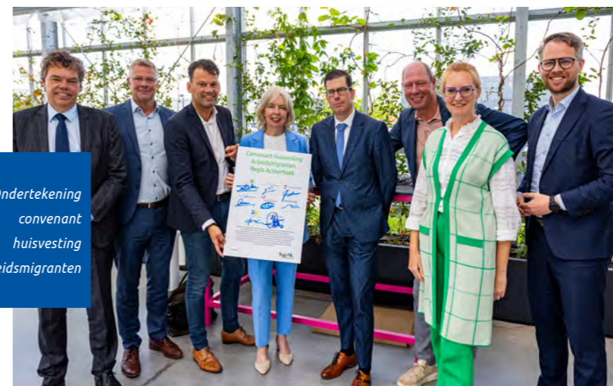
Ondertekening convenant huisvesting arbeidsmigranten