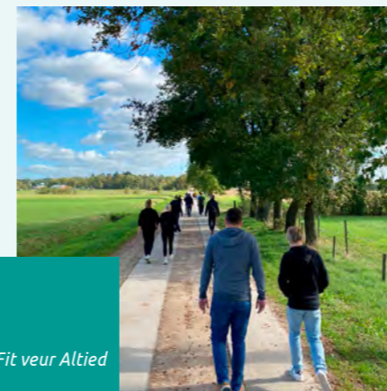
Fit veur Altied