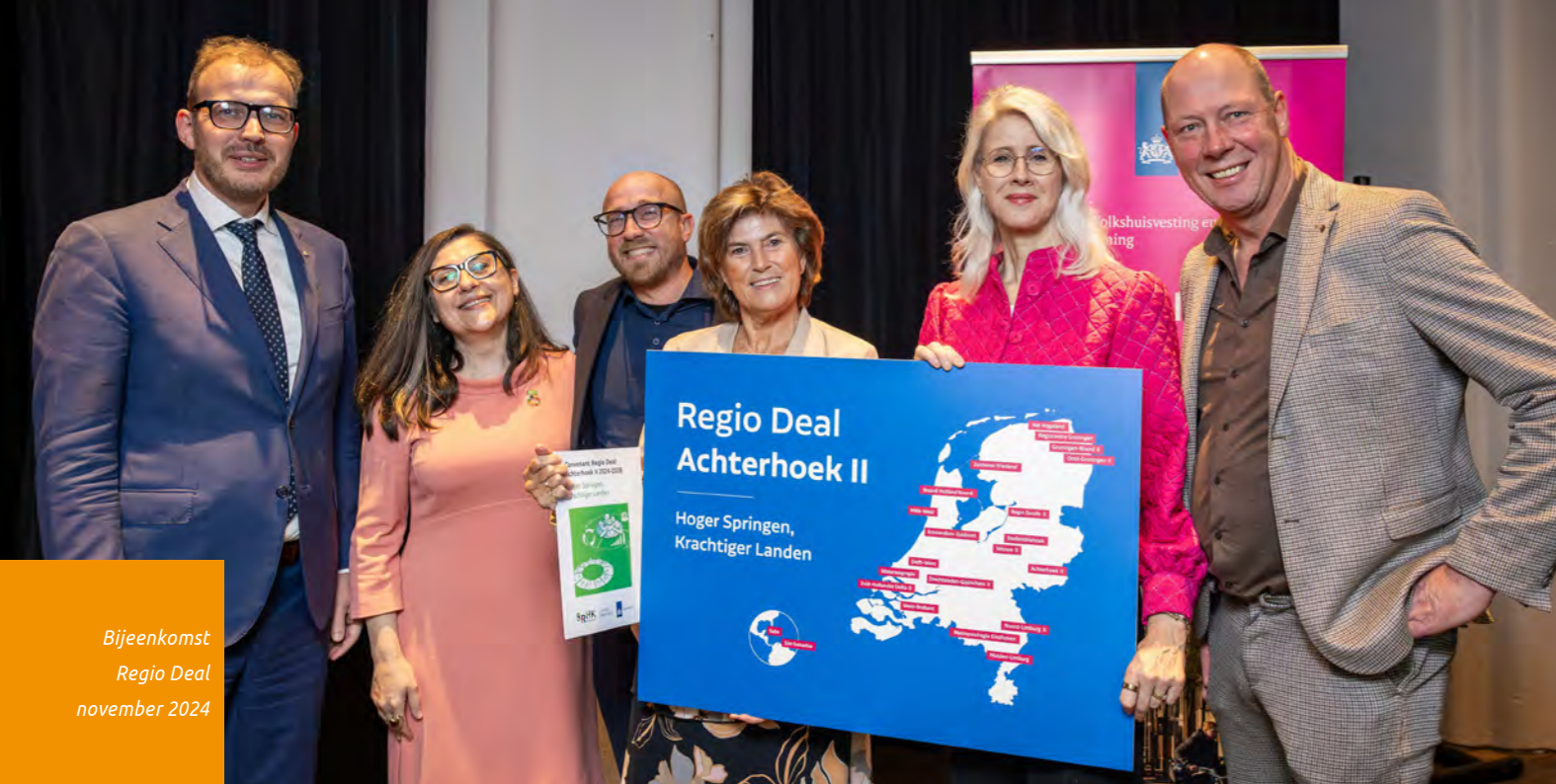
Bijeenkomst Regio Deal november 2024