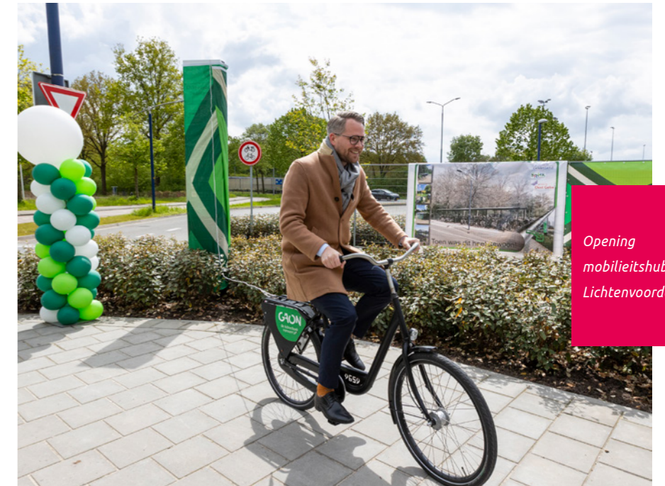
Opening mobiliteitshub Lichtenvoorde

de deelauto in het netwerk van Gaon stimuleren.