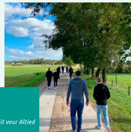
Fit veur Altied