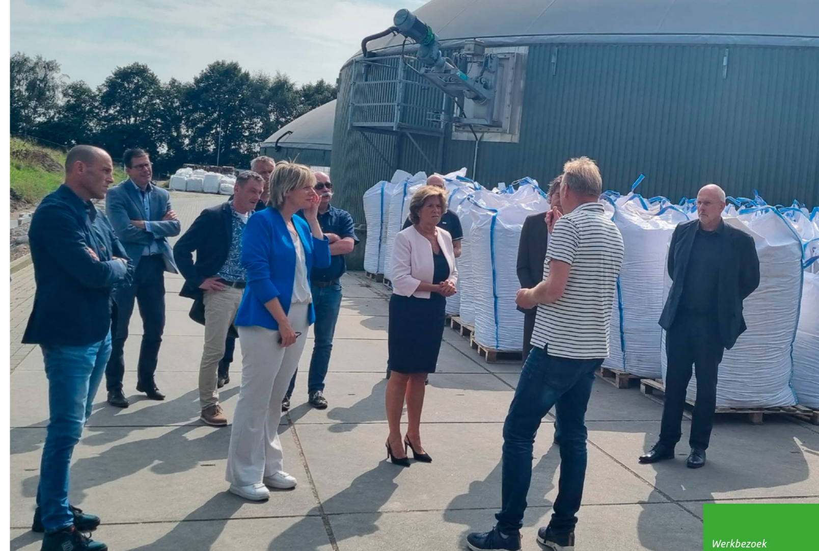
Werkbezoek gedeputeerden Augustus 2024

we de kennisbasis en leren we van praktijkervaringen. Bij experimenten wordt in de uitvoering ook aandacht besteed aan de doorontwikkeling na de experimentele fase. Dit met oog op wet- en regelgeving, (juridische) (on)mogelijkheden en borging voor opschaling en regio brede toepassing.